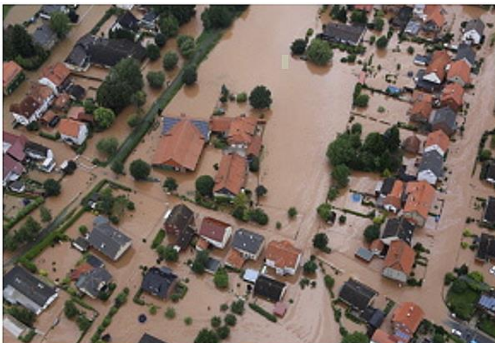
Povodeň v jižním Dolním Sasku v červenci 2017, 23.11

Billy A dělat se proti tomu nic nedá, já vím, neboť lidé tohoto světa se ani nenechají poučit, ani se nechtějí změnit.