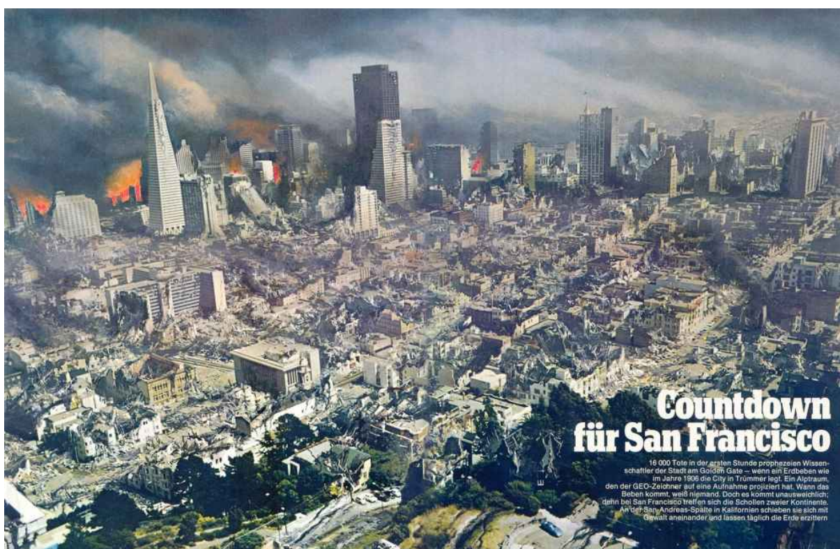
časopis GEO, září 1977

Billy Přirozeně – jak hloupě ode mě. (...)