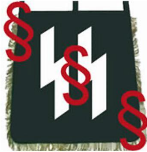
Dvojitá runa »Sig« Ochranného oddílu SS

Ochranný oddíl SS používal runu »Sig« na svém odznaku a přisvojil si tak agresivní dynamickou formu (blesk) a asociaci se slovem »Sieg« (vítězství).