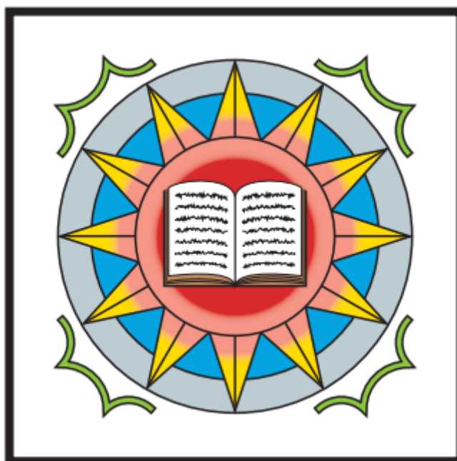
Symbol »Učení Tvořivé energie«