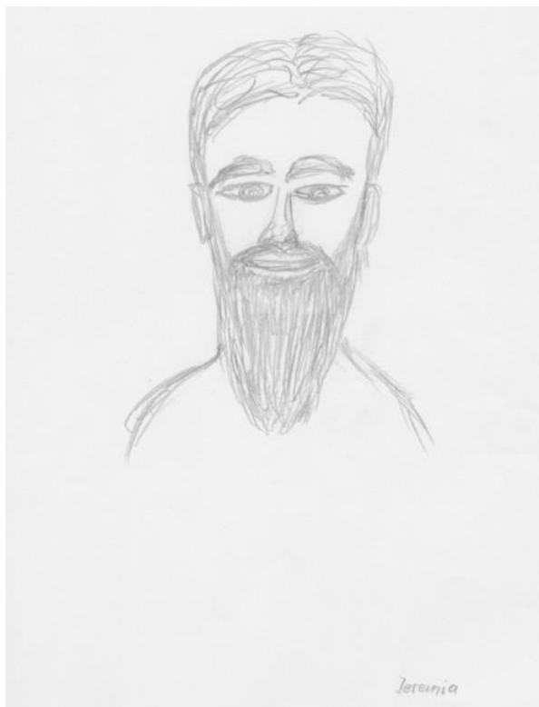
Jeremiáš, kresba od Bermunda