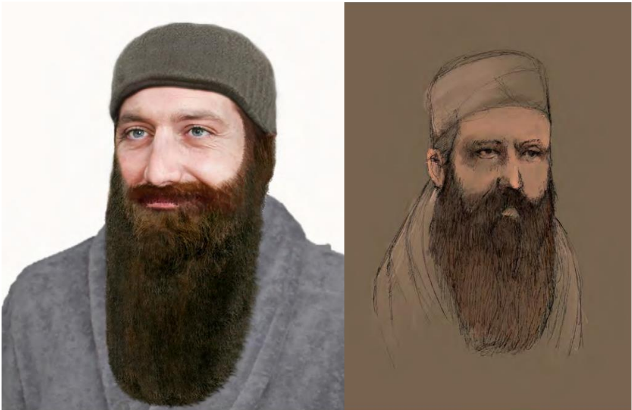
Nokodemion, fotorealistické znázornění, autor: Berke Tepe