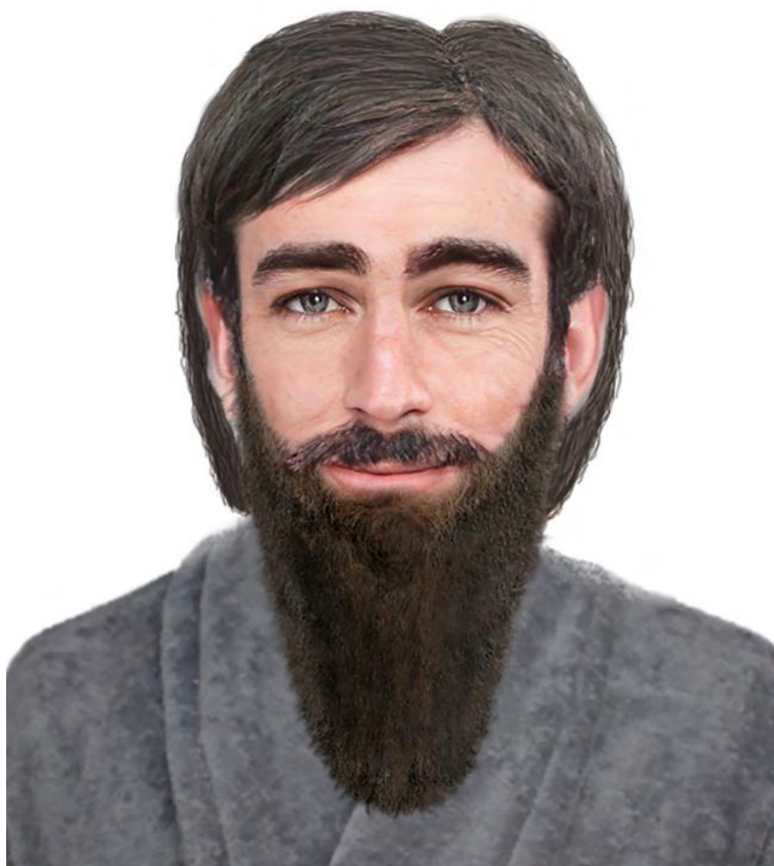
Jeremiáš, fotorealistické znázornění, autor: Berke Tepe