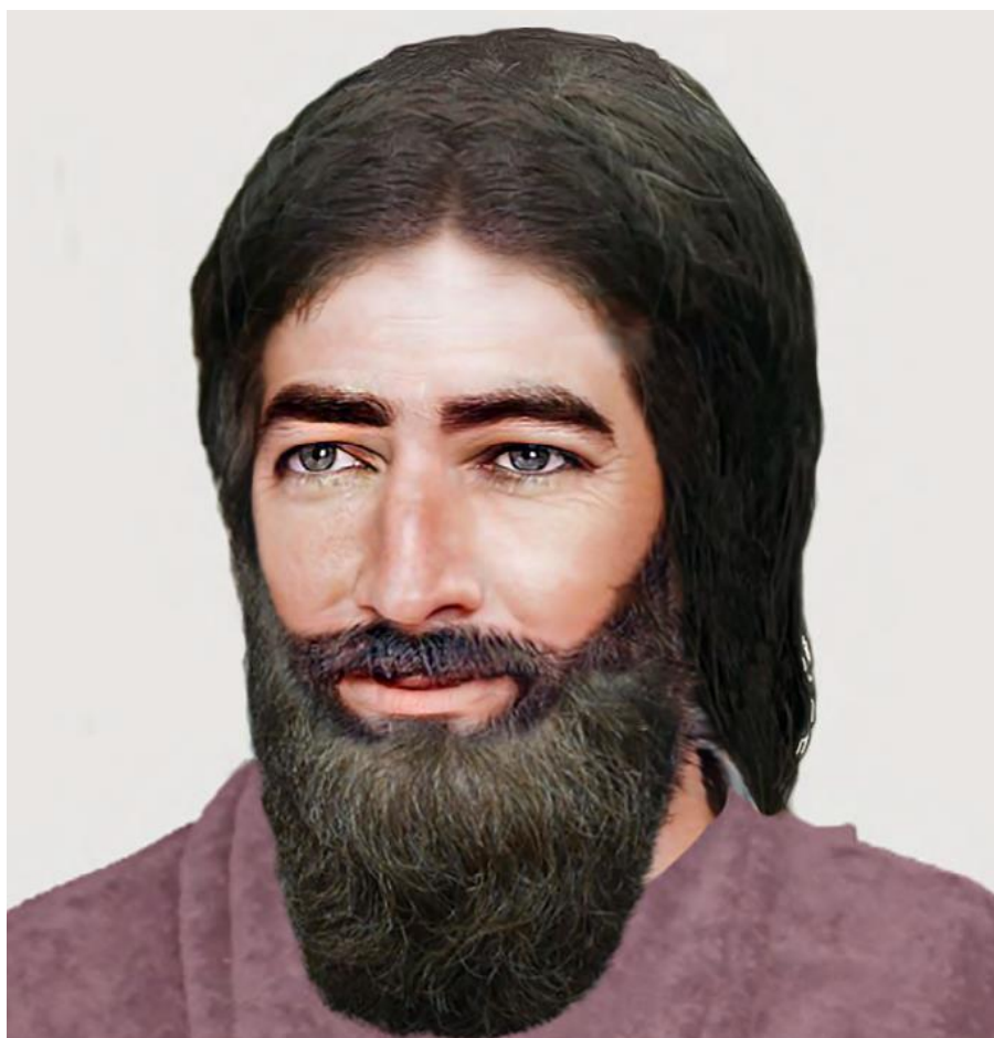
Mohamed, fotorealistické znázornění, autor: Berke Tepe