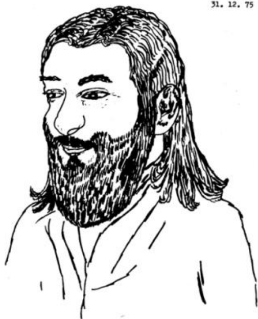
Jmmanuel, kresba od Semjase