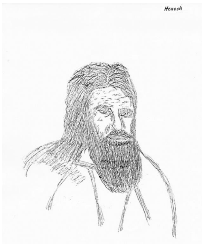
Henoch, kresba od Bermunda