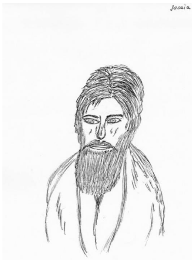
Izajáš, kresba od Bermunda