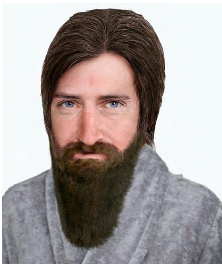
Izajáš, fotorealistické znázornění, autor: Berke Tepe