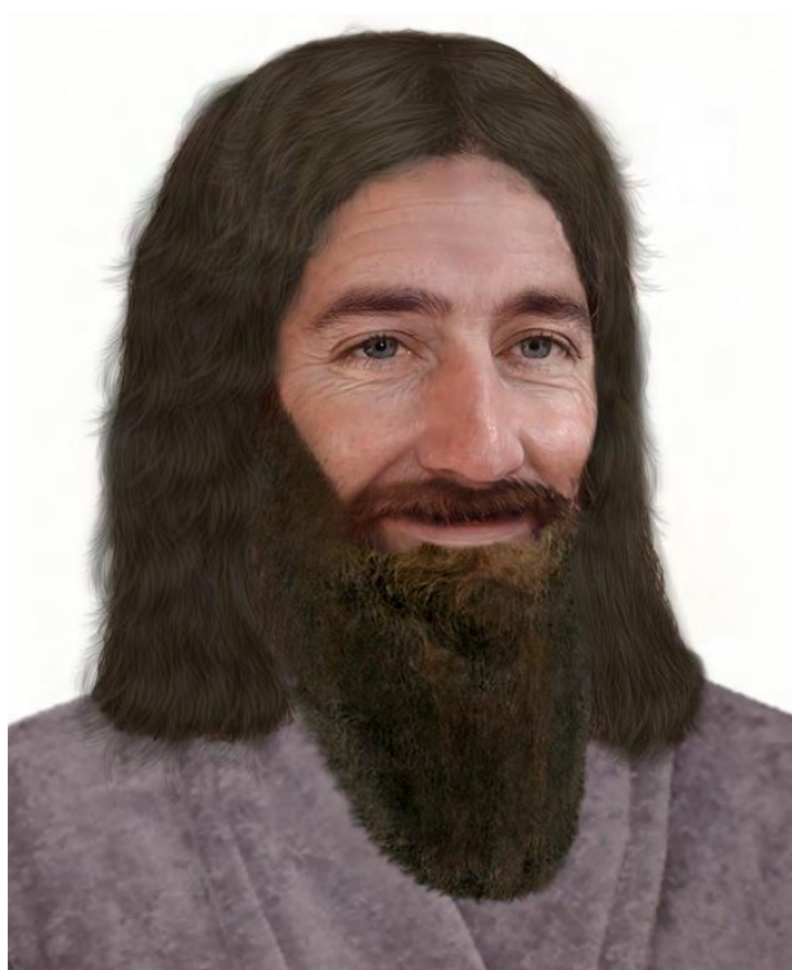
Henoch, fotorealistické znázornění, autor: Berke Tepe