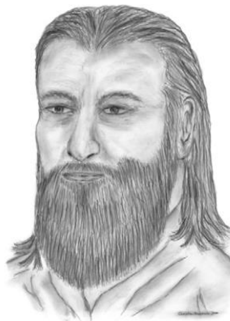
Jmmanuel, kresba od Christiana Krukowskiho