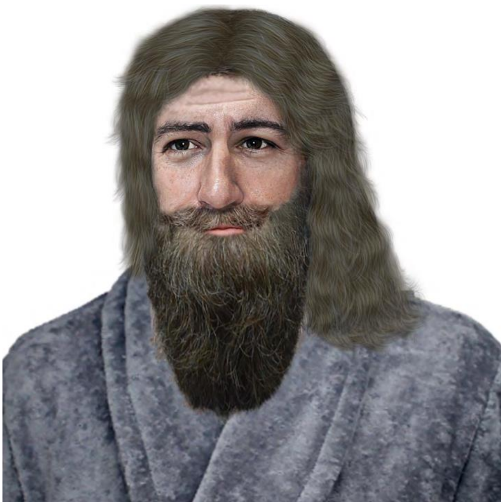
Jidáš Iškariotský, fotorealistické znázornění, autor: Berke Tepe