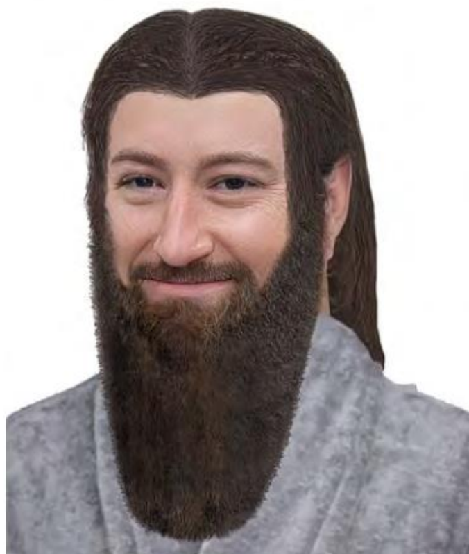
Jmmanuel, fotorealistické znázornění, autor: Berke Tepe