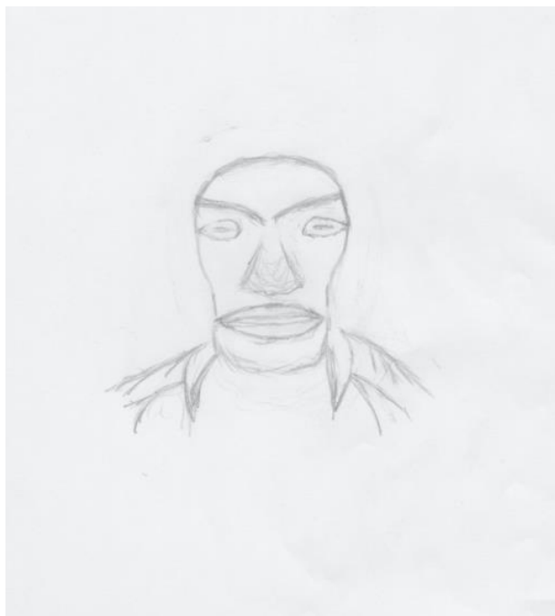
Asina, kresba od Bermunda