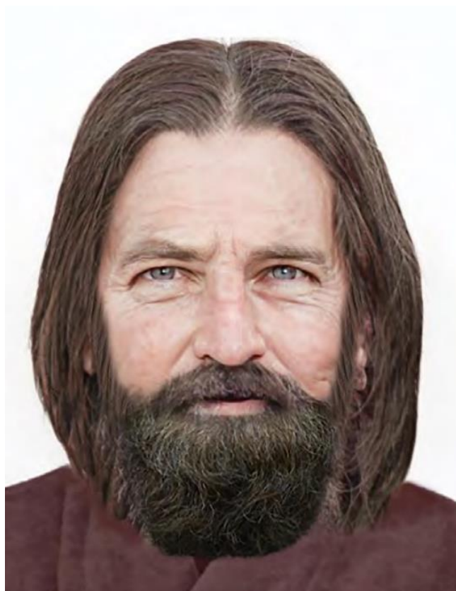
Eliáš, fotorealistické znázornění, autor: Berke Tepe