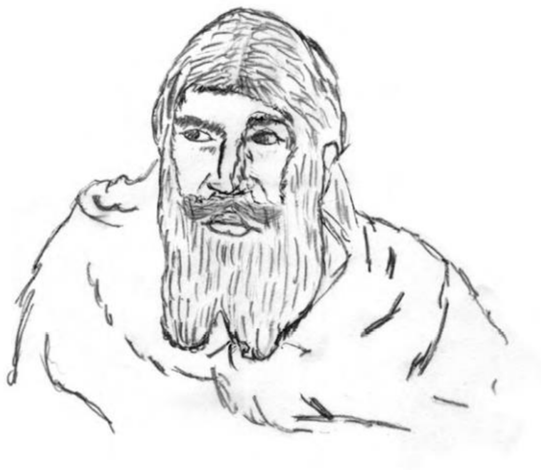
Jidáš Iškariotský, kresba od Ptaah