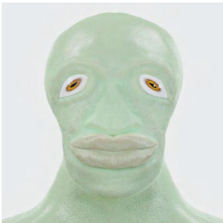
Asina, fotorealistické znázornění, autor: Berke Tepe

COPYRIGHT a AUTORSKÉ PRÁVO 2022 (německy), 2023 (česky) »Billy« Eduard A. Meier, »Univerzální svobodné zájmové společenství«, Semjase Silver Star Center, 8495 Schmidrüti, Švýcarsko. Žádná část tohoto díla, žádné fotografie ani jiné obrazové podklady, žádné diapositivy, filmy, videa ani jiné spisy nebo ostatní materiály atd. nesmějí být bez písemného svolení vlastníka copyrightu v žádné podobě (fotokopie, mikrofilm nebo jiný postup), ani za účelem utváření výuky atd., reprodukovány nebo zpracovávány, rozmnožovány či šířeny pomocí elektronických systémů.